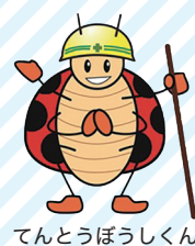
てんとうぼうしくん