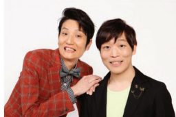
《特別ゲスト》 人気お笑い芸人 ソラシド