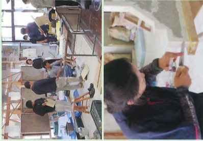
左官タイル施工科